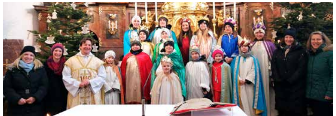
Fotos: Gruppenbild / Ulrike Tatzer, Sternsingergruppe Ursprung / Konrad Pröll